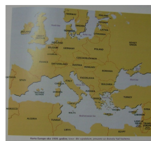
Karta Europe u II. svjetskom ratu

povijesti. Na zemljovidu Europe obojili su zemlje koje su nacisti okupirali jednom bojom i drugom bojom zemlje koje nisu bile okupirane. Na taj način uvidjeli smo u kojoj je poziciji bila naša zemlja. Razgovarali smo o tome iz kojih zemalja su bila djeca koja su umrla i stradala u Holokaustu.