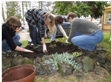
Sadnja lukovica u školski kamenjar